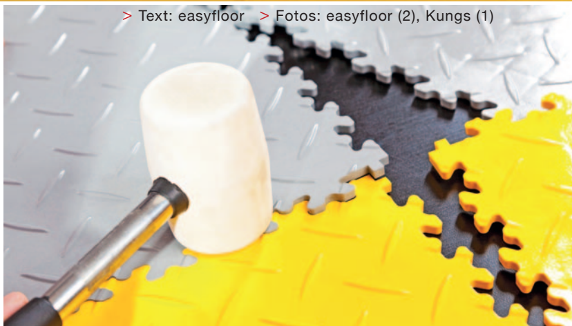
> Text: easyfloor