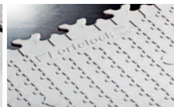
Fortelock für höhere Belastungen